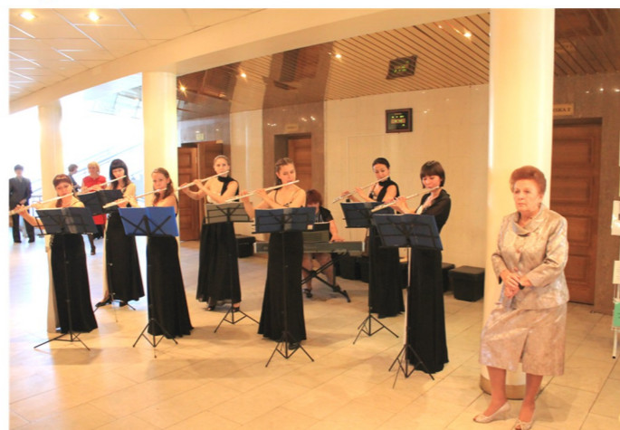
В единении музыки встречали гостей