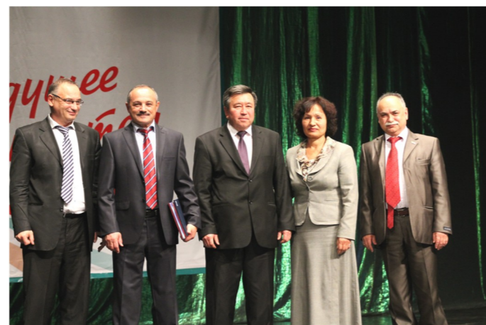
Ректора всех читинских вузов на одной сцене