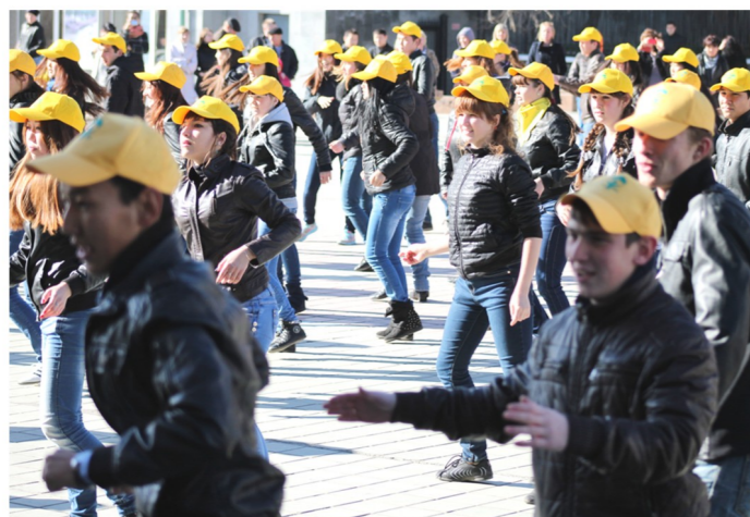
Студенты академии на праздничном флешмобе